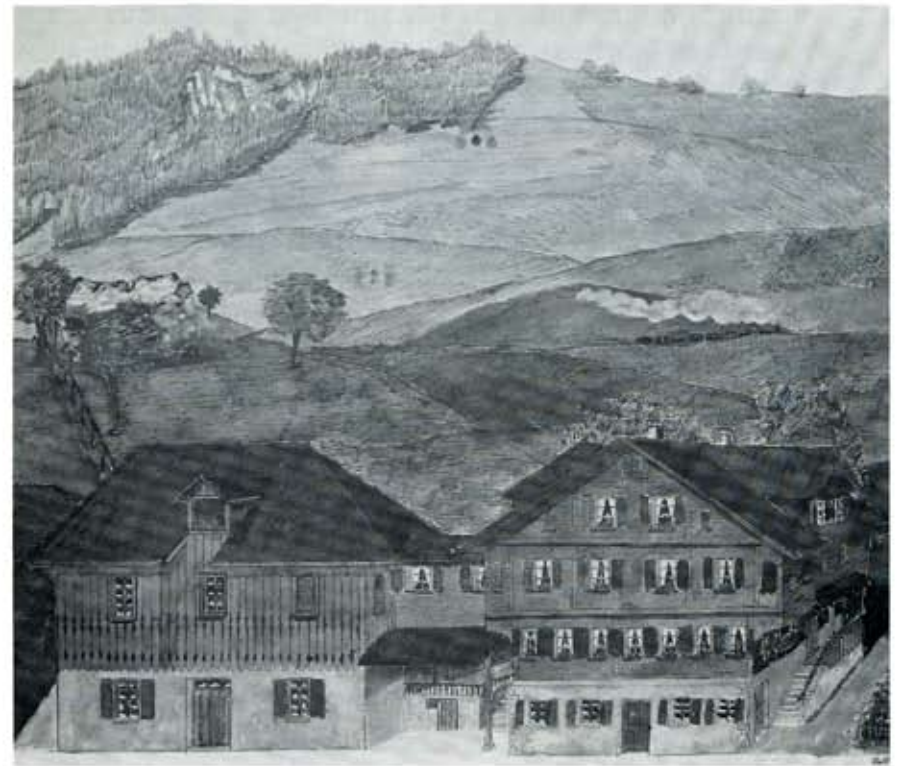
Gasthaus Rudenz "Dreckgass"

Das Gasthaus "Dreckgass" war Haltestelle der Brünig-Pferdepost und seine Frequenz dadurch sehr gut.